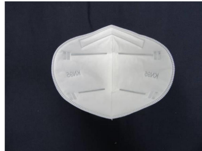
Innenansicht / Inner view