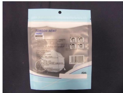
Aufschrift / Label