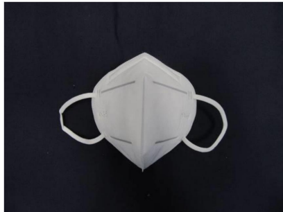
Frontansicht / Front view