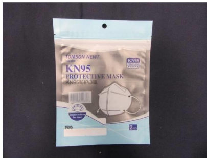
Verpackung / Packaging

Die folgende Maske wurde geprüft / The following mask was tested: