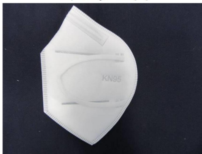
Nasenbügel / Nose clip