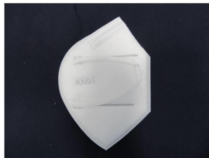
Seitenansicht / Side view